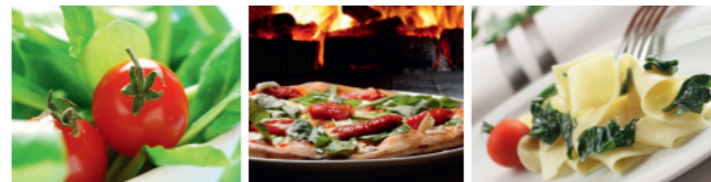
Grafik: brandElements

Rufen Sie uns an und reservieren Sie im Restaurant einen Tisch oder bestellen Sie einfach telefonisch vor, denn alle Speisen gibt es auch zum Mitnehmen.